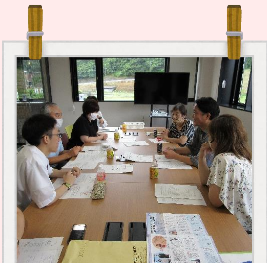
機関紙「はばたき」の発行 市の広報に掲載して情報発信