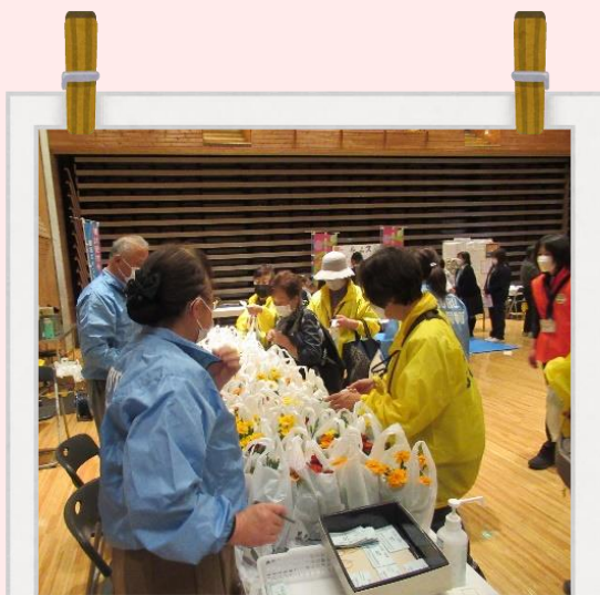
イベントでのブース出展 ボランティアまつりなどに参加