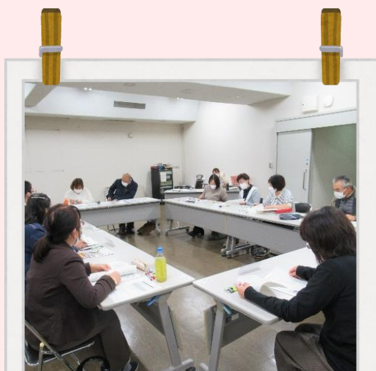
定例会の開催 活動内容などについて協議

私たちの委員会では、 定例会での協議、男女共同参画 推進計画に基づく活動や地域で の啓発活動の実施など、様々な 活動を行っています。