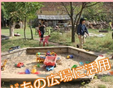
こどもの広場に活用