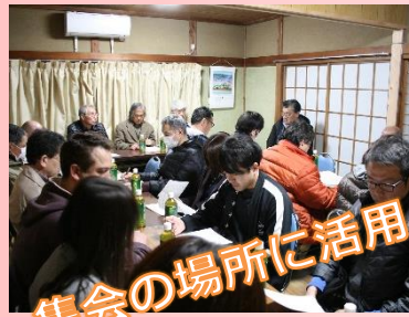
集会の場所に活用