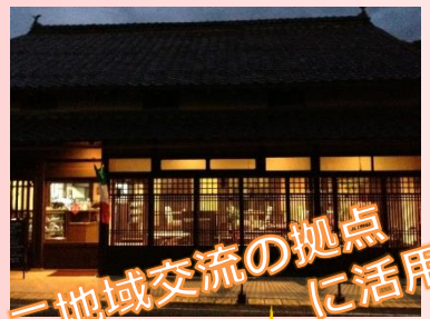
地域交流の拠点に活用