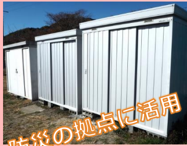
防災の拠点に活用