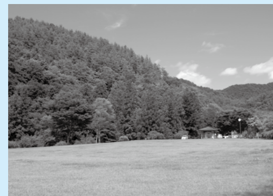
■開催会場となる、和みの里ゆうゆう広場です。ぜひご参加いただき、楽しい一日を過ごしてください!!

日時 10月5日(土)10時 場所 戸沢の森和みの里 ゆうゆう広場 出演バンド数 17バンド ※市内のバンドも出演します! アクセス 駐車場に限りがありますので、都留市駅近くの駐車場からシャトルバスを随時運行する予定です。 問合せ先 行政管理課 秘書・広報担当(広報)