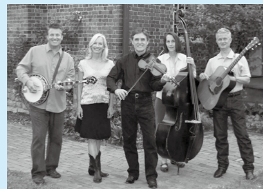
■本場アメリカでミリオンセラーを誇る、ダンカン&フレンズが出演します!!