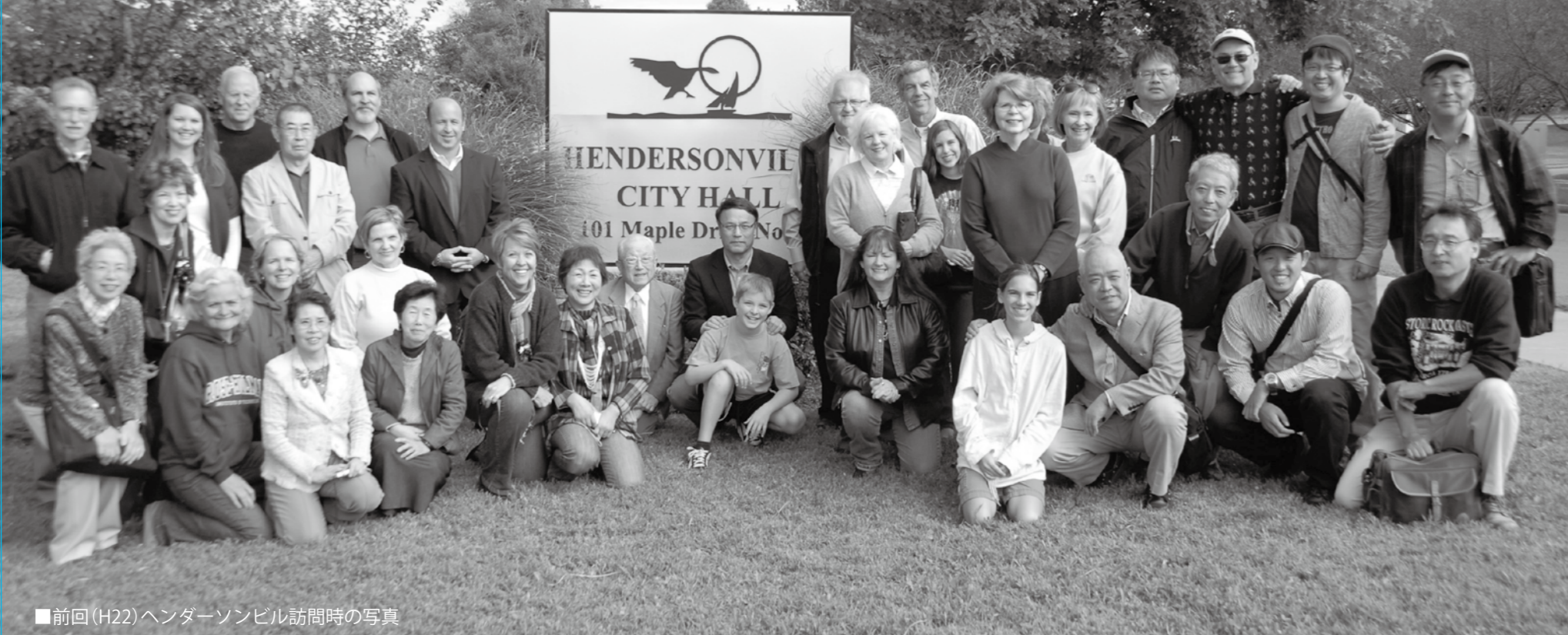
■前回(H22)ヘンダーソンビル訪問時の写真