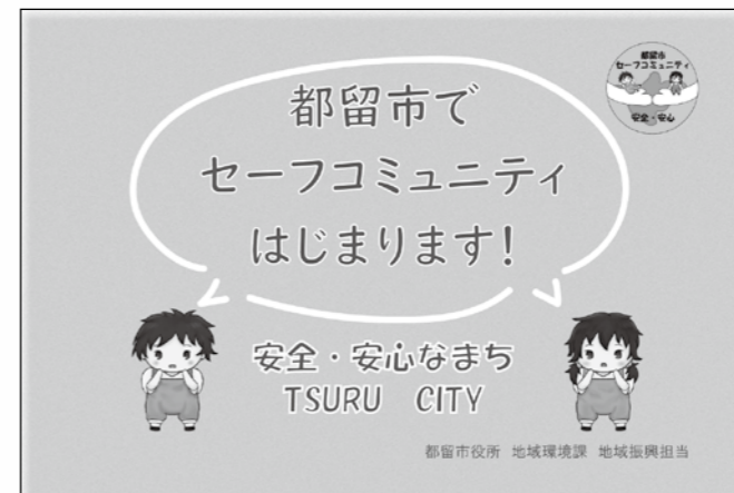
■ポケットティッシュ

■今後、セーフコミュニティの活動を地域の皆さまに知っていただくためのグッズを順次作成していきますのでお楽しみに！