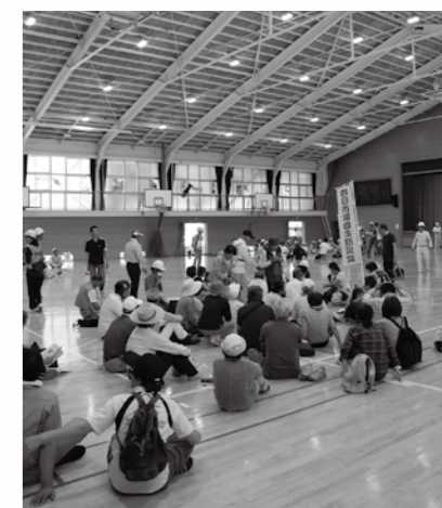
■避難訓練もいざという時に命を守る「セーフコミュニティ」の取り組みの一環です。

「自分の命は自分で守る」ということを頭では理解していても、災害時に実践できなければ意味がありません。普段から市民の皆さんが自ら議論し、災害時に活かしていく「すべ」を共有していれば、いざという時の「命」を守る行動につながります。そのためにも、このセーフコミュニティの取り組みは重要となるのです。