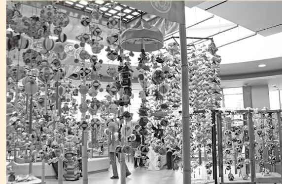
■昨年の展示のようす

※3月号で会期を5月13日(日)としましたが、5月6日(日)の誤りでした。大変申し訳ありませんでした。