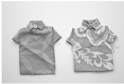
■甲州織のコースター

場所 商家資料館(上谷3-1-20) 入館料 無料 休館日 月、水、金、祝日の翌日 開館時間 10時～16時(最終入館時間15時30分まで) 問合せ 商家資料館 ☎(43)9416