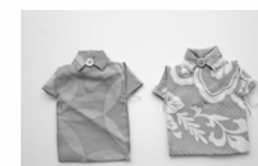
■甲州織のコースター