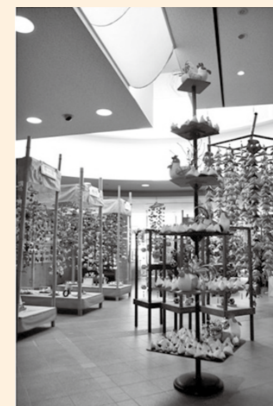
■昨年の展示のようす

開館時間 9時～17時 (入館は16時30分まで) 観覧料 一般 300円(210円) 高・大学生 200円(140円) 小・中学生 100円(70円) ※()内は、20名以上の団体料金です。 休館日 月曜日、第3火曜日 祝日の翌日 問合せ先 ミュージアム都留 ☎45-8008