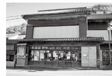
■商家資料館の外観

商家資料館は、かつて都留市が織物のまちとして栄えていた頃、市内に何軒かあった絹問屋の内の1軒で、大正時代中期に建てられた土蔵造りの建物です。平成5年に都留市有形文化財に指定され、現在は資料館として開館しています。そんな大正時代の雰囲気が残る館内で、入館した感想などを俳句にしてみませんか？短冊を用意しておりますので、ご希望の方は館長にお声掛けください。俳句は1カ月まとめてから掲示します。なお、俳句をつくっていただいた方には甲州織のコースターを差し上げます。ぜひ一度ご来館ください。 場所 商家資料館(上谷3-1-20) 入館料 無料 休館日 月、水、金、祝日の翌日 開館時間 10時～16時(最終入館時間15時30分まで) 問合せ先 商家資料館 ☎(43)9416