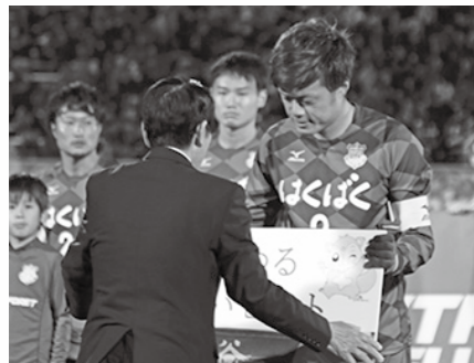
■昨年のサンクスデーのようす

無料招待チケットの抽選配布について 市内に住所のある方を対象に、サンクスデーのチケットを次のとおり抽選にて配布いたします。 申込期限 3月13日(火)消印有効 申込方法 官製はがきに住所・氏名・電話番号・『サンクスデーチケット希望』と記入の上、お申込みください 〒402-8501 都留市上谷1-1-1 教育委員会生涯学習課