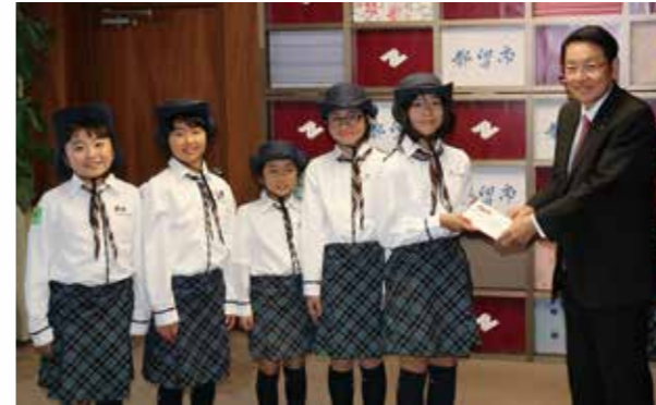
■都留ロータリークラブ・ガールスカウト山梨県第10団から、福祉のために市内3カ所で募金を行った36,426円の寄附をいただきました。