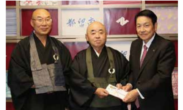
■都留仏教会から、歳末たすけあいとして市内で托鉢を行った182,404円の寄附をいただきました。