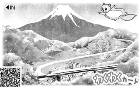
つるポイントカード店会