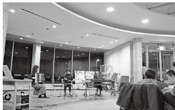
■昨年度の星あかりの芸術祭コンサートのようす