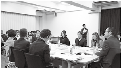
■昨年度に実施した事業評価・提案会のようす