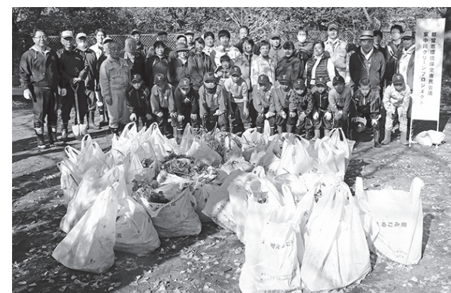
■昨年度は多くの皆さんにご参加をいただき、大変きれいになりました。川のゴミもこんなに集まりました!(写真左)

参加者募集! きれいな川を守ろう! 都留のまちを流れる清らかな川の数は、古くから人々の暮らしを支えてきました。しかし、近年では川へのゴミの不法投棄などの環境問題を抱えています。 そこで、今年もやります! 家中川クリーンプロジェクト! みんなで川をきれいにしませんか? さて、どれだけのゴミが集まるでしょうか? 日時 11月23日(木・祝) 8時20分集合 ※雨天中止 集合場所 市役所駐車場 清掃場所 家中川(元気くん3号~高尾神社入口) 持ち物 長ぐつ、タオル、スコップ、草かじり、ジョレン、竹ぼうきなど(軍手、ゴミ袋は配布します) 主催 都留市、都留市環境保全市民会議 ※小さなお子さまは保護者の同伴をお願いします。 ※駐車場に限りがありますので、お車で越しの場合はできる限り乗り合わせていただくようお願いいたします。