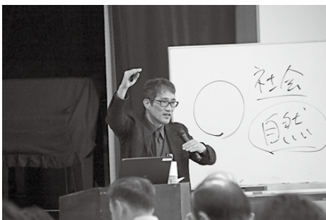
■前回では、講演会を実施し『生涯活躍のまちがめざすところ』をテーマに講演をしていただきました。

本市が進める『生涯活躍のまち』つる『事業』では、都留インターチェンジ近くの旧雇用促進住宅を活用し、サービス付き高齢者向け住宅の整備・運営を行う事業者が決定し、今後はいよいよ田原地区の整備手法を含めた、新たな取組の検討に入る段階となりました。新たな研究会として再出発する今回の研究会は、『まちづくり』や『都留での暮らし方』を主なテーマとして、多くの方の意見をいただき、幅広くビジネスチャンスを探求していく研究会として開催いたします。前回同様、山梨中央銀行と本市の共同主催により開催いたしますので、市民の方をはじめ、各種事業者の方々ぜひご参加ください。詳細につきましては、市ホームページなどお知らせいたします。