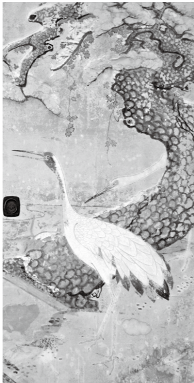
■旭岳麟「松鶴図部分」