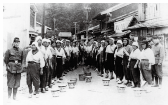
■女性たちの防空演習の様子

7月25日(土)～9月13日(日) ※休館日：月曜日(8月31日を除く)、祝日の翌日