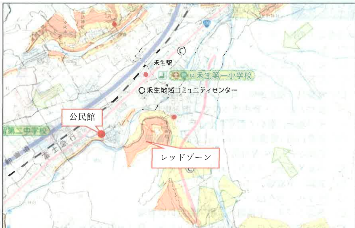
(都留市ハザードマップ：中島地区)