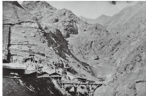
■宝鉱山(戦前、撮影年不詳)