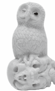
■『自然の気』 青木 昭