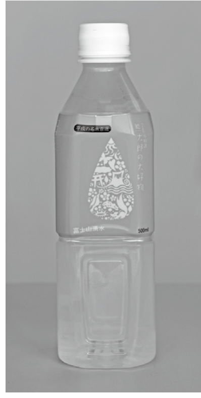
■平成の名水百選 つるの水物語 熊太郎の大好物」 500ml 1000円(税込)

6月1日（木）、販売の再開と水道週間のPRを合わせて、ペットボトル水『平成の名水百選 つるの水物語 熊太郎の大好物』を道の駅つると富士急行線都留文科大前駅で無料配布しました。 このペットボトル水は、昨年5月に発生しました市営第一水源（熊太郎水源）への揮発性有機化合物の混入により一時販売を中止しておりましたが、今年、安全が確認されたため5月10日から販売を再開しています。 こちらのペットボトルは、道の駅つる、芭蕉月待ちの湯、都留市役所 購買部などで購入できますので、ご利用いただけます。すようお願いいたします。