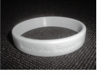
オレンジリングはサポーターの証

認知症サポーターの役割 1 認知症という病気を正しく知る 2 病気を理解することによってその人への支援を考えられる。 3 「自分達の問題である」という認識を持つ 「認知症」を身近な問題として受け止め、自分達にもいつ起こるかわからないと理解してください。 3 地域の中で見守る、支える地域でどんなことができるか考えていく。