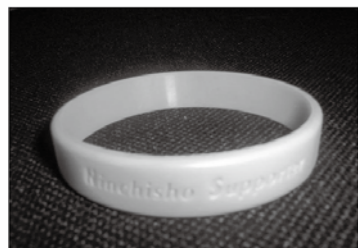
オレンジリングはサポーターの証

認知症サポーターとは? 講座を受けた人を認知症サポーターと呼びます。認知症を正しく理解し、偏見を持たず、認知症の人や家族を温かく見守る応援者のことです。本市には現在3,635人います。サポーターには証であるオレンジリングが渡されます。