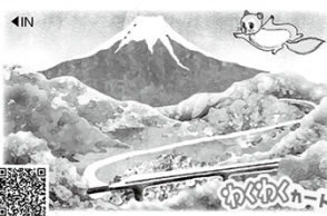
つるポイントカード店会

対象：65歳以上の都留市在住者 キャンペーン期間：平成28年5月～平成29年3月まで