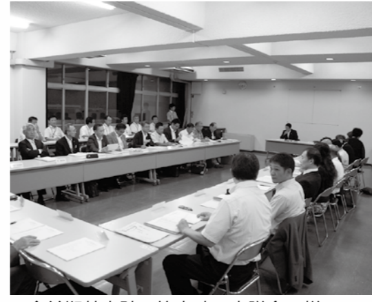
◆前期基本計画策定時の審議会の様子

市では、市政運営の羅針盤となる「第6次都留市長期総合計画(平成28～38年度)の中期基本計画(平成31～34年度)を策定するため、「都留市長期総合計画審議会」を設置します。 計画の策定に向けて、市民の意見などを反映するため、市民意識調査の結果や様々な都留の状況を示したデータを基に、今後のまちづくりの方向性や取り組みについて審議していただく審議会委員を募集します。あなたの声を市政へ届けてみませんか。 対象 市内在住の18歳以上の方 定員 若干名 任期 平成31年3月末まで 申込締切日 11月12日(月)12時 申込方法 電話にてお申し込みください。 報酬 市の規定により委員報酬を支給します。(交通費の支給はありません。) ※希望者多数の場合は、選考させていただきます。詳しくはお問い合わせください。