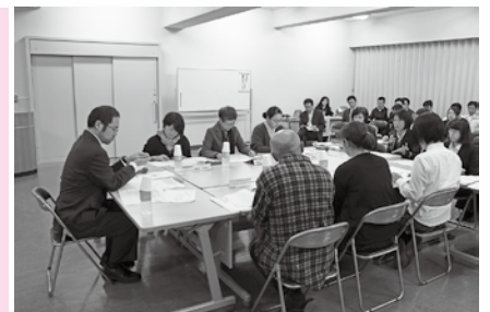
■昨年度に実施した事業評価・提案会のようす

本市では、市民の皆さまから政策や事業などに対する評価や提案をいただくため、『事業評価・提案会』を実施しています。これは、市の将来像である『ひと集い 学びあふれる 生涯きらめきのまち つる』を実現するため実施している事業について、有識者や市民の皆さまなど行政外部の視点から評価や提言を伺い、今後の政策に活用することを目的として実施するものです。 今年度は、主にリーディング・プロジェクト及び都留市総合戦略に位置付けられた事業を主な対象として実施します。 当日は、どなたでも自由に傍聴できますので、ぜひご来場ください。 日時 11月11日(金) 19時～21時 11月17日(木) 19時～21時 場所 市役所3階大会議室 対象事業 ・お話し居住や都留市PR動画などの移住促進事業 ・いーばしよ(居場所)づくり整備事業 ・市街地商店街活性化事業 ・子育て世代包括支援センター設置事業など ※事業が変更となる可能性もあります。