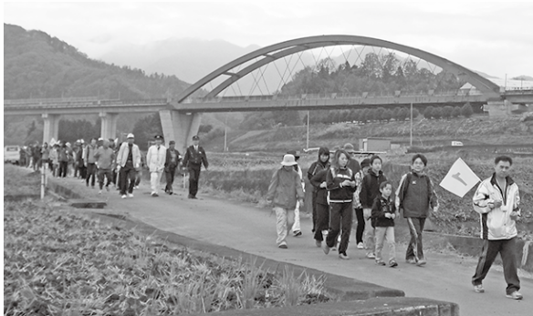
■昨年度実施の歩け歩け大会『禾生地区』のようす

日程 11月23日(水・祝) 集合時間 8時30分受付開始 ※開会式までに必ず受け付けをしてください。 開会式 9時(小雨決行) 集合場所 都留第一中学校 コース 都留第一中学校(出発)→小野熊野神社→沢田橋→文大附属小学校(昼食)→真福寺→都留第一中学校(到着・解散14時30分予定) ※天候や交通状況等でコースを変更する場合があります。 目的 『市民歩け歩け大会』を通じて健康づくりを行うと共に地域を知り、地域の新しい発見をする。 対象者 どなたでも参加できます。(小学校3年生以下は必ず保護者が同伴してください) 当日具合の悪い方はご遠慮ください。 持ち物 弁当、水筒、雨具、帽子、その他各自必要なもの