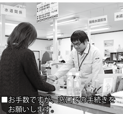
■お手数ですが、窓口での手続きをお願いします。

水道の使用を「中止」するとき、「閉栓届」を 市内から引っ越しをされる方・転居される方は、使わなくなった水道を止める手続き(閉栓届)が必要です。この手続きを忘れると、使用の有無にかかわらず、水道料金が発生しますのでご注意ください。 水道の使用を「開始」するとき、「開栓届」を 市内に引っ越しされた方・転居された方で、新たに水道を使用する場合には、利用を開始する手続き(開栓届)が必要です。新しくお住まいになる場所の水道が出る状態であっても、利用を開始する手続きが必要です。手続きが行われず無断使用が判明した時は、直ちに給水を停止しますのでご注意ください。 また、手続きが遅れている場合には、使用を開始した時にさかのぼり料金をお支払いいただきますので、忘れずに手続きをおこなってください。 ■手続きの方法 上下水道課窓口にて平日の8時30分から17時15分まで受け付けています。開栓届・閉栓届の際には、それぞれ手数料として300円が必要となります。 ※電話での受付はしておりませんので、必ず上下水道課窓口までお越しください。