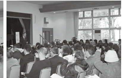
■福島氏に東を問われ…全員バラバラな角を指さす。これが組織だったらどうだろう。