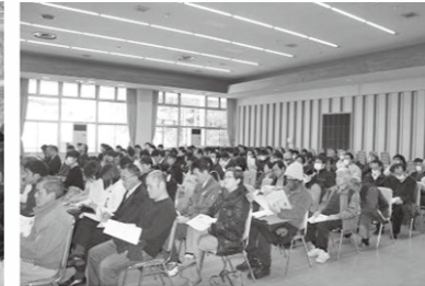
■会場には約200名の方が訪れ、ディズニー流のおもてなしに耳を傾けました。