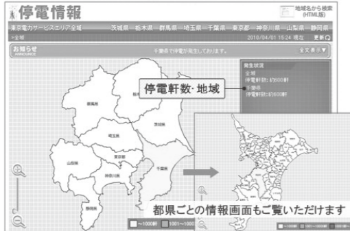
■サービスエリア全域および都県ごとの情報画面

当社は、電気の安定供給のため設備の保守・点検に努めておりますが、地震や台風・降雪などにより広域に停電が発生し、多くのお客様さまに多大なご迷惑をおかけしてしまつ場合がございます。 停電が発生した場合には、迅速な復旧に努めてまいります。被害が大きい場合や、道路事情が悪く現場での作業が困難な場合などは長時間の停電になることもございます。 東京電力ではサービスエリア内で停電が発生した際に、停電地域や復旧見込み時刻などの情報をHPでお知らせするサービスを提供しております。 また、モバイルサイトでも同じ情報がご覧いただけますので、停電時や外出中でもスマートフォンやタブレットからご覧いただくことが可能となっております。 ※ブックマークやお気に入り登録しておく、素早く確認することが可能です。 なお、東京電力カスタマーセンターでは、全日24時間電話でのお問い合わせを承っておりますが、停電などの緊急時、お問い合わせが集中するためお電話が繋がりにくい状態になり、情報収集が困難な状態になりますのでHPでの確認をお勧めします。 問合せ先 東京電力カスタマーセンター ☎0120(995)882