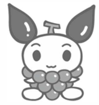
山梨の献血キャラクター けんけつちゃん

献血していただける方 健康な16歳～69歳の方。なお、65歳以上の方は60歳～64歳のあいだに献血経験がある方に限ります。