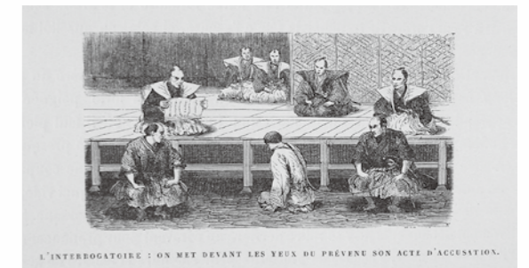
■エメ・アンベール『幕末日本図絵』挿絵