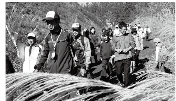
■昨年度実施の歩け歩け大会『三吉地区』のようす

日程 11月23日(月・祝) 集合時間 8時30分受付開始 ※開会式までに必ず受け付けをしてください 開会式 9時(小雨決行) 集合場所 禾生第一小学校 コース 禾一小(出発)↓二ヶ堰碑↓県立リニア見学センター(自由時間)↓尾県郷土資料館(昼食)↓禾一小(到着・解散14時30分予定) ※天候や交通状況などでコースを変更する場合があります。 ※リニア見学センターの入場料は自己負担です。 金額 一般・大学生330円 / 高校生240円 / 中学生・小学生170円