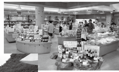
■『道の駅もてぎ』のようす