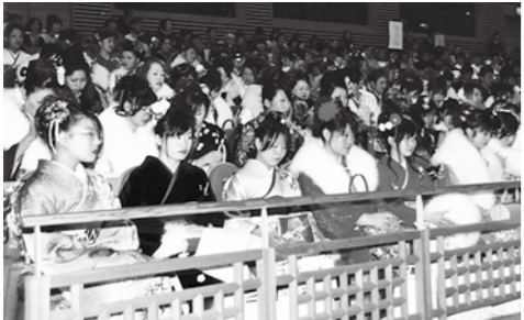
■本年度30歳の方が参加された成人式の様子(平成17年度1月)

平成27年度都留市30歳同窓会実行委員会委員募集 本市ではこれからの社会の中心を担っていく世代の交流の場を設け、人口減少の克服や地域の再生・活性化を図るため、平成28年3月19日(土)(予定)に本年度30歳になる方を対象とした30歳同窓会を開催します。