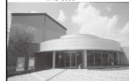
■昭和20年代 谷村裁判所外観

開館時間 9時～17時 観覧料 一般 300円(210円) 高・大学生 200円(140円) 小・中学生 100円(70円) ※( )内は、20名以上の団体料金です。 休館日 月曜日、第3火曜日 祝日の翌日 問合せ先 ミュージアム都留 ☎45-8008