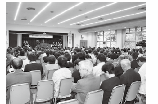
■昨年の開会式の様子

10月・11月の2カ月間を生涯学習月間と位置付け、「都留いきいきフェスティバル」を開催します。市民の皆さんに文化、芸術、健康、スポーツなどに関心を持っていただき、いつでも自由に学び、学んだことを生活に活かすきっかけを作っていたため、多彩な事業を企画しています。詳しくは広報10月号でお知らせします。