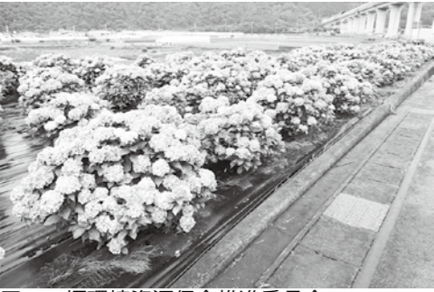
■二ヶ堰環境資源保全推進委員会 アジサイ植栽地の様子

5月に市民の皆さまにお願いしていました「緑の募金」について、今年度は総額2,327,111円の募金が寄せられました。 募金につきましては、山梨県緑化推進機構を通して、市の緑化推進事業や学校林整備事業、緑の少年少女隊育成事業などに活用されます。 市の緑化推進会議においても募金を活用し、地域内の公共の場所に桜やツツジ、アジサイなどを植える事業を行っています。自治会などのイベントで地域内の公共の場所に花木の植栽希望がありましたら左記担当までご連絡をお願いします。 ※事業費に限りがありますので植栽希望多数の場合は、応募順となります。内容によっては希望に添えない場合や次年度事業へ回す場合もありますのでご了承ください。 問合せ先 産業課農林振興担当