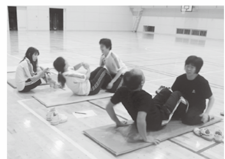
■昨年度の体力・運動能力調査に参加した皆さんのようす(右から「上体起こし」「長座体前屈」「反復横跳び」)