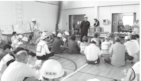
■6月の防災訓練において非常食の説明を受ける市民の皆さん(禾生地区)

市では、防災体制の確立と市民の防災意識の高揚を図ることを目的に地震発生から災害応急対応までの総合的な地震防災訓練を防災関係機関や自主防災会などと連携し今年度も行います。 訓練の日時 8月30日(日)8時～12時 訓練は、8時ごろから防災行政無線の斉放送にて始まり、メイン会場は、旭小学校校庭・体育館です。盛里地区の皆さんぜひご参加ください。 訓練内容(予定) 避難訓練 防災倉庫確認訓練 障がい者、高齢者避難誘導訓練 応急手当訓練 その他地域の実情に即した訓練