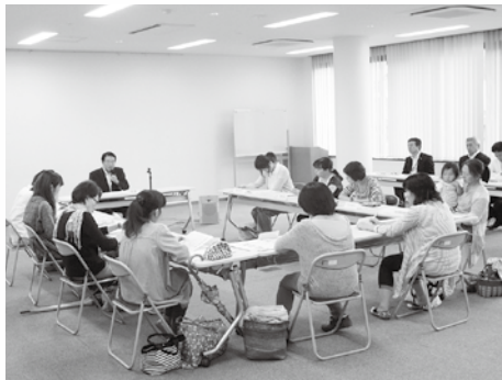
■ふれあい集会(きらめき女性塾)の様子

今回は、「市長から学ぶ都留市のこと」と題する講座を、「都留市ふれあい集会」と位置づけ、本市が重点施策として取り組む事業などの説明や意見交換を行いました。