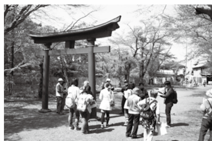
■昨年度に実施した「古写真の城下町を歩く」の様子

開館時間 9時~17時 ※増田誠美術館は16時30分まで 観覧料 一般 300円(210円) 高・大学生 200円(140円) 小・中学生 100円(70円) ※( )内は、20名以上の団体料金です。 休館日 月曜日、第3火曜日 祝日の翌日 問合先 ミュージアム都留 ☎45-8008