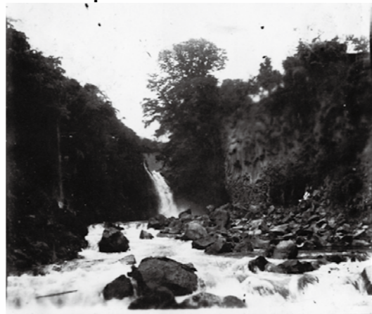
■写真:『田原の滝』 昭和10年代

開館時間 9時～17時 ※増田誠美術館は16時30分まで 観覧料 一般 300円(210円) 高・大学生 200円(140円) 小・中学生 100円(70円) ※( )内は、20名以上の団体料金です。 休館日 月曜日、第3火曜日 祝日の翌日 問合先 ミュージアム都留 ☎45-8008