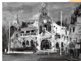
『プロヴァンの教会』1968(6号)