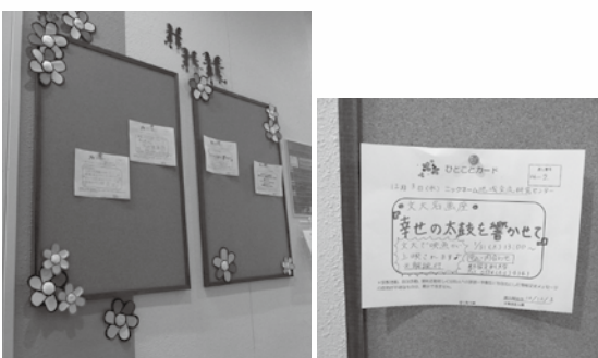
■皆さんの「ひとこと」をたくさん掲示してください！

先月の協働通信でお知らせしたとおり、まちづくり交流センター内事務室隣に、市民の皆さんが気軽に情報を発信し、受け取ることができる「ひとこと掲示板」を設置しています。積極的なご活用をよろしくお願いいたします。