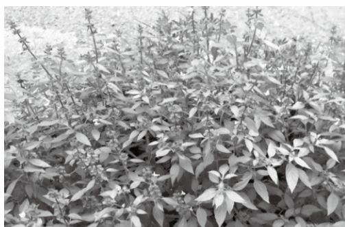
■暖かくなる頃に育つトウルシーは、独特の良い香りで、小さな紫色の可愛い花を咲かせます。

▽都留市まちづくり市民活動支援センター 都留市中央3-8-1 都留市まちづくり交流センター (旧文化会館)1階 ▽開館 火～日(祝日除) 8:30～17:15 ▽問い合わせ先 mail: shien@city.tsuru.yamanashi.jp ☎(43)1321 FAX(43)1322