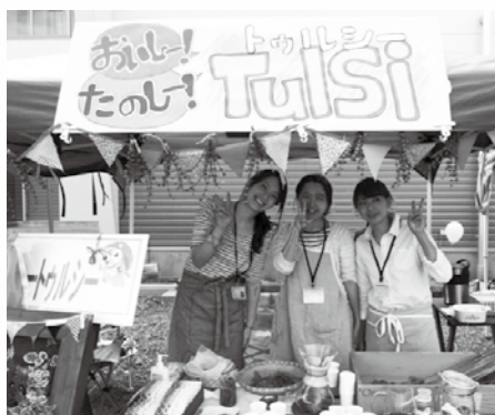
■昨年10月つる産業まつりに出店し、300名の方に種を配布し、試食用にトウルシー入りのバジルソースも用意しました。

今年の秋にはトウルシーを使った料理教室を開催したり、つる産業まつりに出店し種の無料配布を行いました。