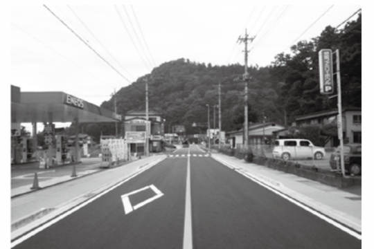
■歩道完成(平成26年9月)

対して出入り口の位置と幅の調整を行う予定です。 対象となる沿道の皆さまのご協力をお願いします。