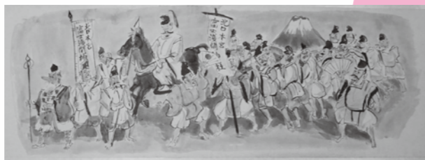
『北口本宮富士浅間神社 すずき祭り』 制作年不詳