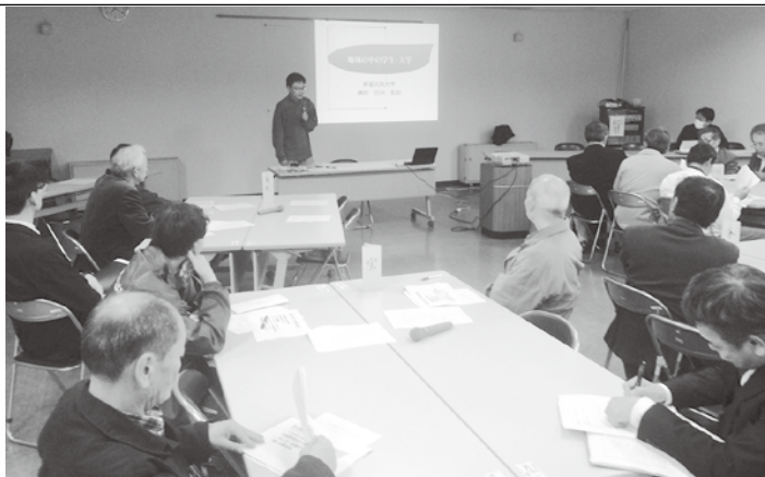
■昨年度は都留文科大学や学生との交流について、意見交換を行いました。

都留文科大学の学生との交流が印象的でした。まちづくりに興味のある学生にご出席いただき、学生の目線からみた都留のまちづくりについて意見を