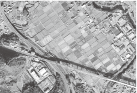
■現在のリニア実験線付近のようす

市では「夢かなう都留市」の実現に向けて取り組む第1のコンセプト「創ります 豊かな産業のあるまち」の中で、重点施策として「特徴ある農業の構築と人材育成」を目指しています。 リニア見学センターのリニューアルやリニア中央幹線実験線への一般試乗が開始されることから、その集客を見込み、その近くに大規模な農林産物直売所を建設するとともに、周辺に体験農園や観光菜園施設などを配し、全国から訪れる観光客の取り込みを図る施設の基本構想、基本計画の策定を行い、平成28年夏のオープンを目指し事業を進めています。 この施設は、安心安全な農産物の生産、持続可能な農業経営の実現に向けた市の農業振興の核となる施設を目指し構築するものであり、農業所得の向上が図れるように推進していきます。