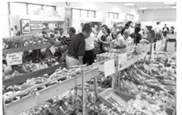
■直売所のイメージ

直売所運営に一番重要なことは、野菜などの卸しを行う生産者の育成と組織作りです。市では多くの方に直売所の生産者として登録いただき、直売所に来場される方が、都留市の恵みを味わい、感動し、満足していただける施設を目指して事業を進めており、生産者の方々の発掘と育成が急務であり、また、直売所運営に携わる市民の方の力が重要です。 そこで、下記のとおり農林産物直売所講演会と農業技術の向上のための講習会を開催します。現在農業をされている方や今から農業を始めてみたい方、また、直売所にご興味のある方など、多くの方の参加をお待ちしています。