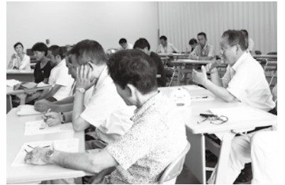
■市内商店の活性化に向けて、積極的な意見交換が行われました。

7月23日(木)、市役所3階大会議室において、第6回都留市ふれあい集会を開催しました。今回のふれあい集会は商店連合会・飲食店組合・市内店舗経営者を対象として開催いたしました。 集会の中で市長は、事業コンセプトである「輝かせます！都留の誇り」の中で、リニア見学センター観光客の市内誘客に関連し、市内商店街の活性化に絡めた取り組みを行っていきたいと説明したところ、参加者の皆さんから次のような意見が出されました。 ■参加者の皆さんからの意見 ・都留市の商店活性化のため、高尾町通りなどを歩行者天国として開放し、市内各店舗が