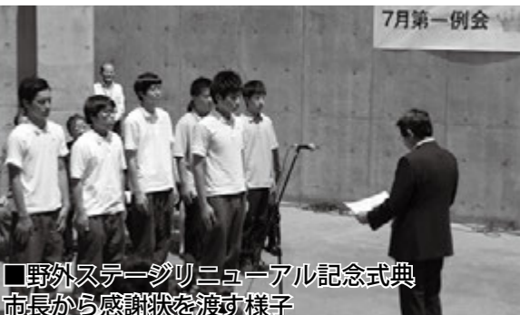
■野外ステージリニューアル記念式典 市長から感謝状を渡す様子