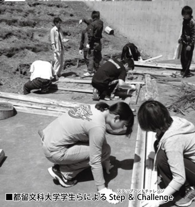
■都留文科大学学生らによる Step & Challenge