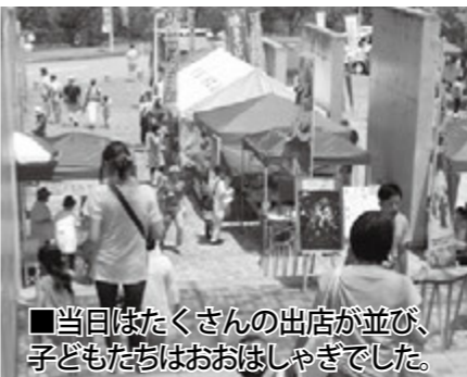
■当日はたくさんのお店が並び、子どもたちはおおはしゃぎでした。

7月12日(土)、うぐいすホール野外ステージのリニューアルを記念した記念式典と、関連イベントが行われました! 広報でも取り上げてきましたが、うぐいすホールには、草木が生い茂り使用されていない野外ステージがありました。そこで、およそ2年前からRe:Tsuruのプロジェクトとして、新しい多目的ステージに整備し直すことで、市民の表現の場所として活用されるように取り組んできました。 (※Re:Tsuruとは、都留市地域活性化コンソーシアムといい、市民・学生・企業・行政が協働で市を活性化させる取り組みをしている団体です。) プロジェクト発足当時は、リツールのメンバーが中心となり作業にあたっていました。2年の間に、谷村工業高等学校建設科の生徒や都留青年会議所による協力、市民による炊き出しの協力など、多くの皆さんにより完成することができました。 その感謝の意を表すために、市からリツール・谷村工業高等学校・都留青年会議所へ感謝状が送られました。リニューアルにご協力いただいた皆さま、本当にありがとうございました。 式典終了後は、都留青年会議所主催で、ステージを利用したイベントが行われました。Re:Tsuruブランドでシルクのネクタイ生地を利用して作ったドレスのファッションショーや、サクライザーショーなどが行われ、客席はおおいに盛り上がりしました。その後、極真会館都留道場による空手の演武や富士五湖アコースティックギタークラブを中心としたライブパフォーマンスが行われました。歌われた方には「自然の中で歌える環境は音の響きが独特で心地良いので、歌っていて楽しい。」と好評でした。