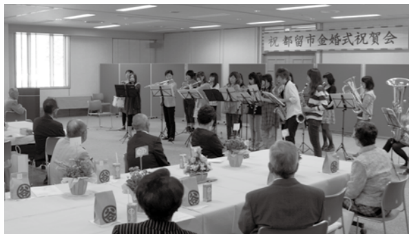
■昨年の金婚式祝賀会では保育園児によるお遊戯や、ボランティアの方々による演奏などが披露されました。

都留市社会福祉協議会では、結婚50周年を迎えられたご夫婦を対象に金婚式祝賀会を開催します。お申し込みがお済でない方は、上記までお早めにお電話で申し込みください。 平成26年度金婚式祝賀会の開催のご案内 日時 9月26日(金)14時から (受付13時30分から) 場所 都留市下谷2516-1 いきいきプラザ都留3階 参加料 無料 内容 金婚(結婚50周年)を迎えたご夫婦をお祝いします。 結婚50周年を祝う式典 ・アトラクション ・記念写真撮影 対象 次のいずれかに該当し、市内に住居登録のあるご夫婦 1. 昭和38年9月16日～昭和39年9月15日の間に婚姻されたご夫婦 2. ※この間に事実上婚姻していれば婚姻の届出日は問いません。 昭和38年9月15日以前に婚姻され、これまでに金婚式祝賀会に参加されていないご夫婦