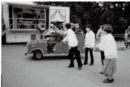
■都留市防災フェスティバルで活動する都留市赤十字奉仕団員

赤十字奉仕団とは、赤十字の使命とする人道的な諸活動を実践しようとする人々が集まって結成されたボランティア組織です。 おもな活動内容は、市の総合防災訓練や赤十字社主催の炊き出し訓練・応急救護訓練への参加、献血会場での奉仕活動、救急法（心肺蘇生法、包帯法、止血法など）修得のための研修、介護老人保健施設「つる」や特別養護老人ホームでのボランティア活動など、赤十字の理念に基づき、人々のしあわせを願い、明るく住みよい社会を築くため、様々な活動に取り組んでいます。 都留市赤十字奉仕団では、男女を問わず新規団員を募集しています。奉仕団活動に興味がある方は、上記までお問い合わせください。