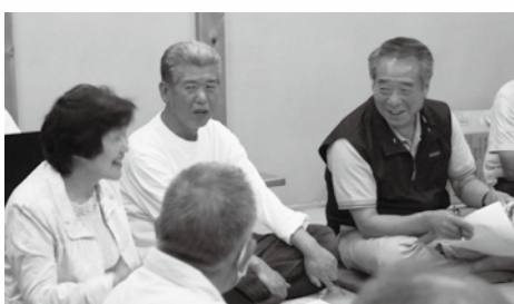
■市長コンセプトについてや、地域の諸問題などいろいろなお話ができました。

題になった内容で今年度に対応可能なものなどは、すぐに担当部署へ周知し、順次対応してまいります。と考えています。