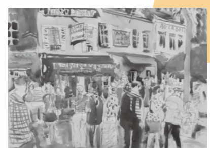
『モンパルナスの丘』(デッサン)

会期: 3月8日(土)～6月8日(日) ※3月3日(月)から7日(金)までは、展示替えのため休館します。 開館時間: 9時～16時30分 会場: 増田誠美術館(ふるさと会館2階)