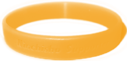
■認知症サポーターの証 オレンジリング