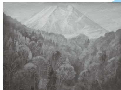
『富士晩秋』南部陽一朗 油彩画10号