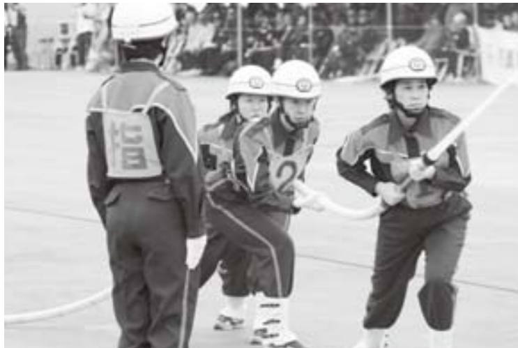
■一昨年行われた第20回全国女性消防操法大会の様子

市では、消防本部付「女性消防隊員」を募集します。市内に居住又は勤務(通学)する、年齢18歳以上の健康明朗で消防防災活動に貢献しようとする意欲のある女性を対象とします。隊員は、女性の特性を活かした地域の安全、安心を守るため、主に応急救護の指導や防火・防災などの啓発活動を行います。 なお、本年10月に横浜市で開催される「第21回全国女性消防操法大会」に山梨県代表として出場が決定しています。