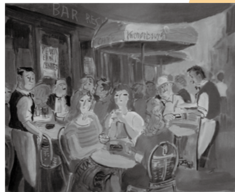
■サンミッシェル通りのカフェ』増田誠 (リトグラフ)