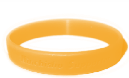
オレンジリングはサポーターの証

講座を受けた人を認知症サポーターといいます。現在都留市では1,311人のサポーターがいます。サポーターは認知症を正しく理解し、偏見を持たず、認知症の人や家族を暖かく見守る応援者です。受講してまずはあなたが理解者になりましょう。 日時 3月6日(水) 18時30分～20時 場所 都留市文化会館 1階会議室 講師 都留市地域包括支援センター職員 内容 認知症の症状、治療予防および対応など話し合いをしながらわかりやすく講話します。 対象 主に市内に在住する人 費用 無料 申込 前日までにお申込みください。