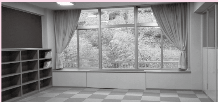
■おはなしコーナー(乳幼児読書室)

3階に「おはなしコーナー(乳幼児読書室)」が新設されました。親子などでの絵本の読書、読み聞かせなどにご利用いただけます。