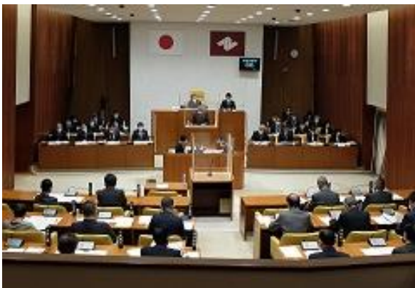
傍聴席から見た本会議場の様子

なお、各定例会や臨時会の日程は、議会だよりやホームページ(「定例会・臨時会情報」)でお知らせしています。