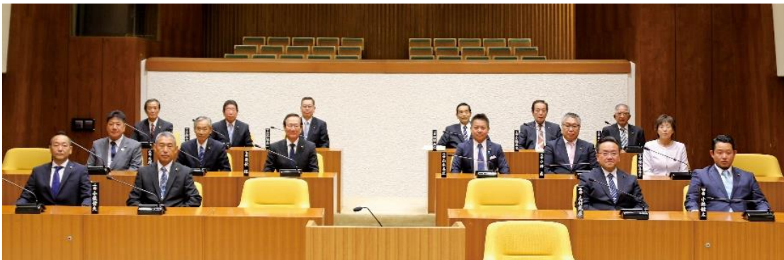
令和元年 5月臨時会

議員は4年ごとに市民の皆さんの選挙によって選ばれます。議員の定数は、条例によって定められており、現在、都留市議会議員の定数は16人となっています。