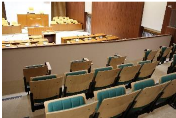
本会議場の傍聴席