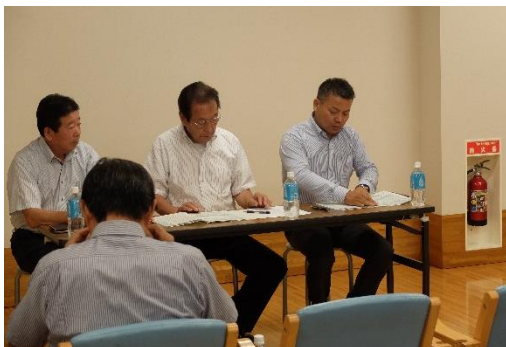
いきいきプラザ都留