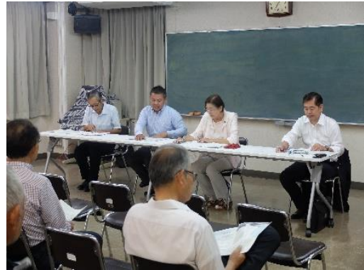
東桂地域コミュニティセンター