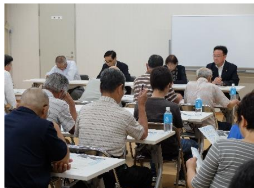
宝地域コミュニティセンター