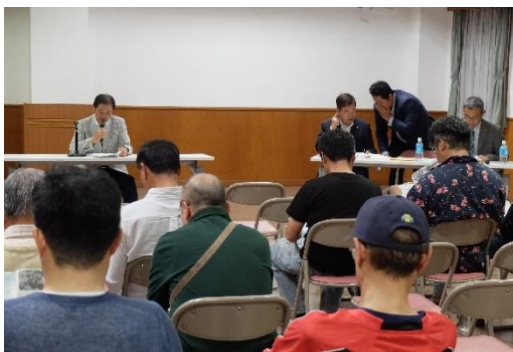
禾生地域コミュニティセンター