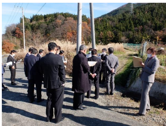
富士北麓・東部地域ゴミ処理施設予定地 (西桂町小沼)