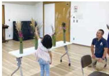
子どもと一緒に自然に触れ合える 里山の生け花ワークショップ