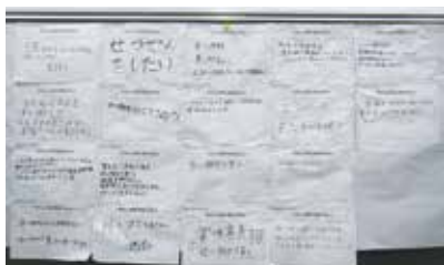
◀児童の皆さんの「わたしの取り組むSDGs」