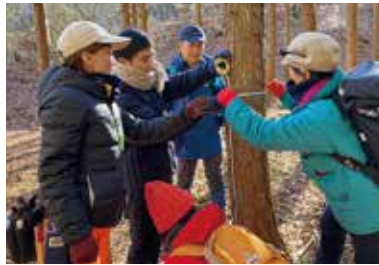
持続可能な環境づくりへの関心を高める森づくりワーク企業研修