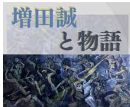
▲増田誠 「オリンポスの神々とギガンテスの戦い」