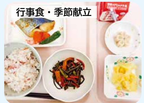
季節感や行事を楽しんでいただけるように行事食・季節献立を提供します。例) 鮭を使った春メニューやケーキが付いたクリスマスメニューなど