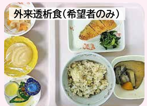
タンパク質、塩分、水分を抑えて、エネルギーを摂れる食事となっています。