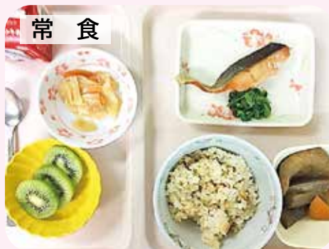
一般的な入院患者の方に提供する入院中の食事です。

病院食の一例をご紹介します。基本的に使われている食材は一緒ですが、患者さまの状況に合わせて調理や提供の方法などを工夫しています。常食の一例) あさりご飯、鮭の塩焼き、含め煮、カブのごま和えなど