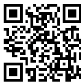
▲インタビューの視聴はコチラから