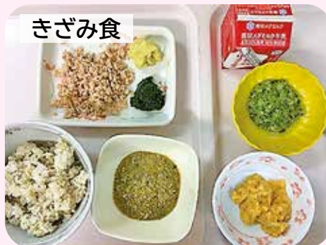
噛む力が弱くなった方には噛まずに飲み込めるよう刻んで提供します。さらに噛む力が弱くなるとミキサーでトロミをつけた食事になります。